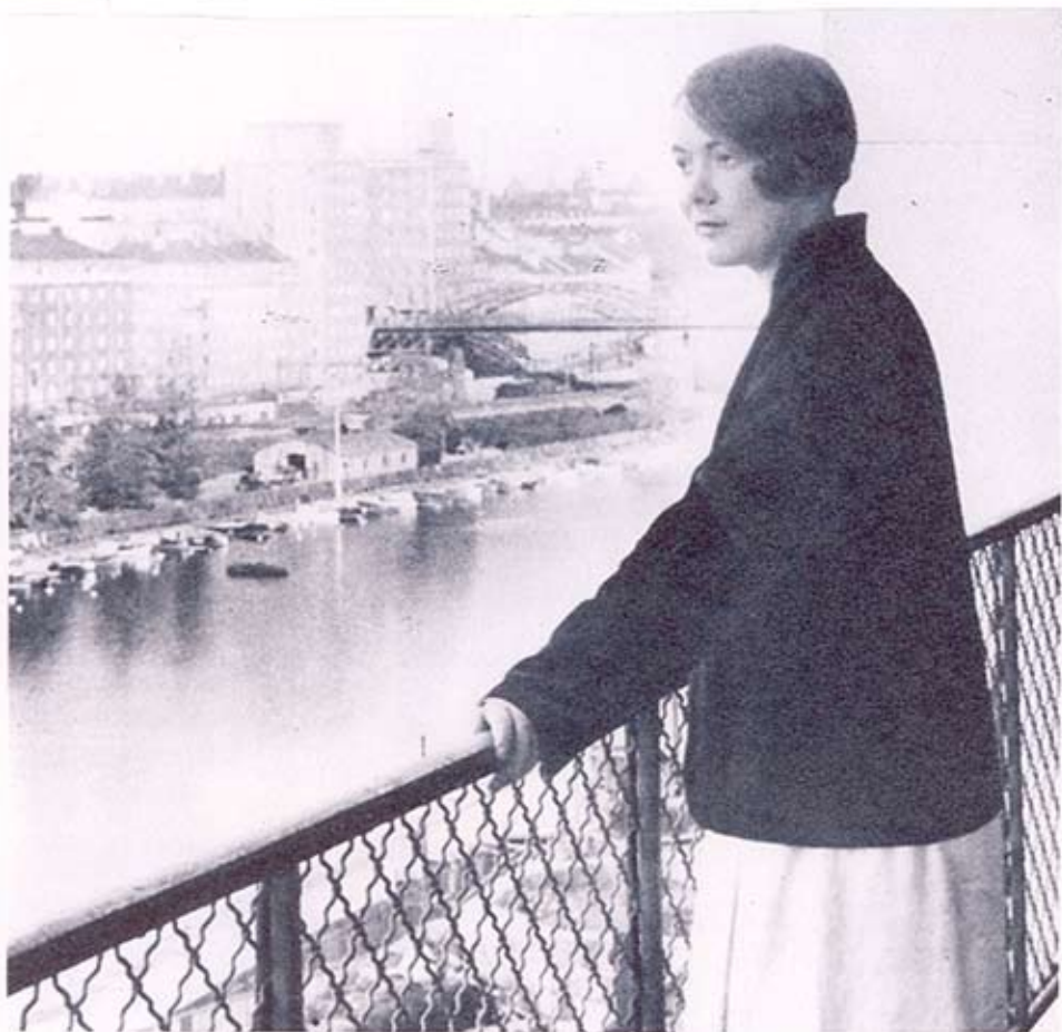
Karin Boye på sin stockholmsbalkong.

Fotografiet förefaller vara taget i samband med utgivandet av prisbelönade romanen Astarte 1931. Bilden finns i den stora jubileumsboken Bonniers Förlag 100 år 1937 .